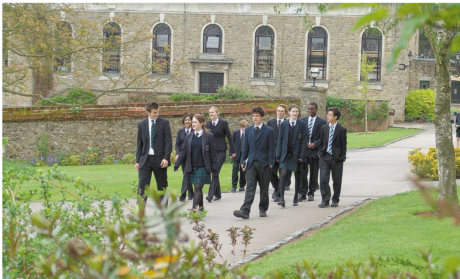
Das Internat Sevenoaks in der Nähe von London – Deutsche Eltern schätzen die Disziplin und die internationale Ausbildung an englischen Privatschulen.

Insgesamt 5 000 deutsche Schüler gingen derzeit auf ein englisches Internat, sagt von Bülow-Steinbeis. Dieses Jahr wird sie rund 300 Schüler nach England vermitteln, 2007 waren es 200 und im Jahr davor nur 100. Sie vermittelt Schüler sowohl für kürzere Zeiträume von drei Monaten oder einem Jahr als auch Schüler, die gleich ihren Abschluss in England machen wollen. Wählen können sie dabei zwischen dem A-Level, dem englischen Abschluss, der dem deutschen Abitur entspricht, und dem IB. Studieren kann man mit beiden Abschlüssen auch an deutschen Universitäten, beim fachgebundenen A-Level allerdings muss auf die Wahl der Fächer geachtet werden, um sicher zu sein, dass man tatsächlich die deutsche Hochschulreife erlangt. Aber nicht nur englische Inter-